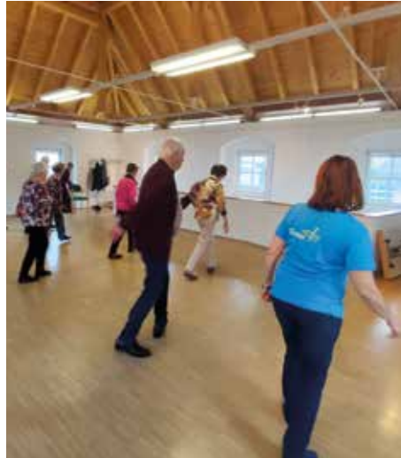
„Tanzen ab der Lebensmitte“ im Rahmen der Gesunden Gemeinde