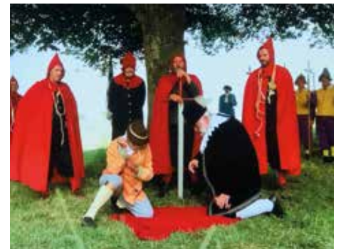
Bauernkrieg

meinde mit Chören und anderen Ensembles, die die Kultur und Tradition unserer Region zum Klingen bringen.